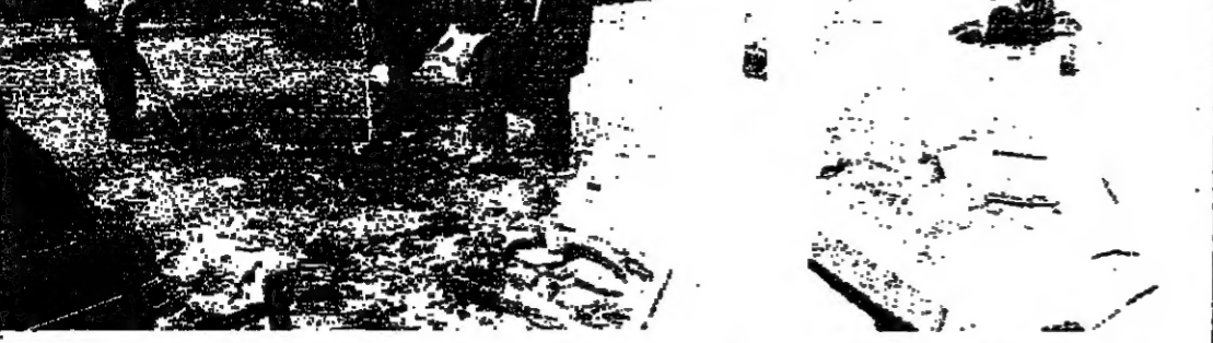
نيش الزيت تهيدا لتركيك شطاه النورمة طريق السراي